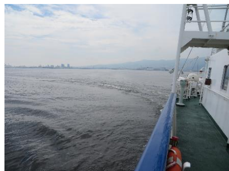
操縦性能体験(急旋回・緊急停止) 航跡は弧を描きます