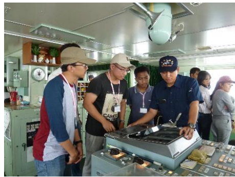
ブリッジでの操舵体験