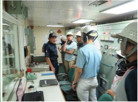
エンジンルーム見学