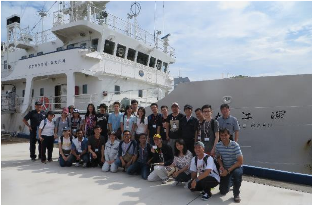
集合写真(深江丸にて)