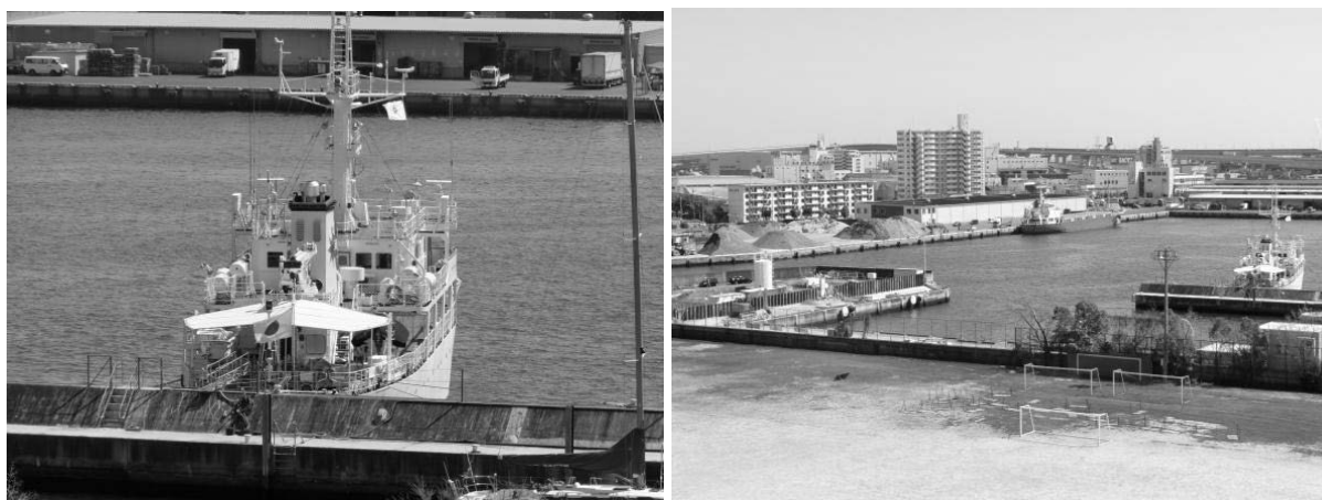
図 7-1 深江丸の防波堤への船尾係留（ポンド浚渫中）

◎ 深江丸へようこそ！ http://www.edu.kobe-u.ac.jp/gmsc-fukaemaru/